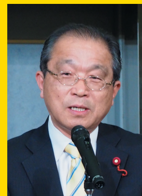
福岡市議会議員【東区】